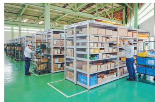
工場内の2か所に保管場所が分散。ピッキング作業は、倉庫内の棚から棚へ歩き回って必要な部品を探し集めていました。