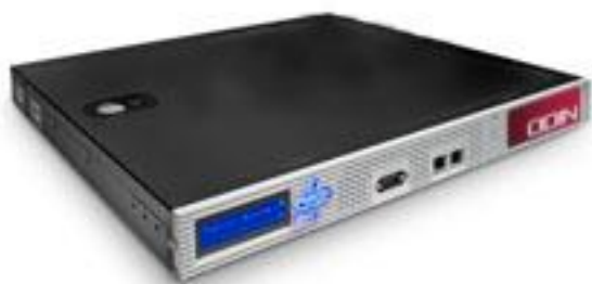
RFID ネットワークコントローラ (ODIN EasyTAP721)

RFID ゲートでは、当社の RFID ネットワークコントローラを活用し、RFID ゲートを通過したオリコンやカゴ台車のみを自動認識する“タグトランジション”機能を利用することで、周辺の移動しないカゴ台車との識別を行い、タグの誤読みを防ぎ、読取り精度を上げています。